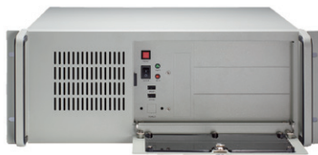
▲ Front view