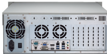
▲ Rear view